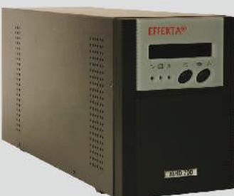
Serie MHD mit RS232 + USB + LCD-Display