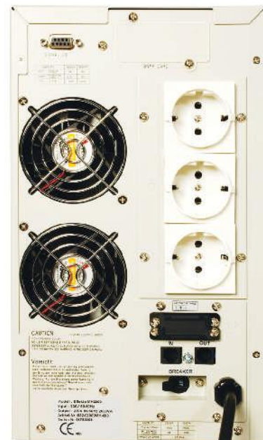
Rückseite MH 2000-3000